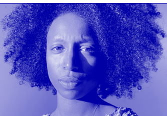
Productrice radio, danseuse, autrice, traductrice

Francéclat, Paris; Bureau du Design, de la mode et des Métiers d'art, Paris; Fondation Bettencourt Schueller, Paris; WantedDesign, New York