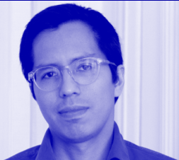
Artiste ★ New York

Parallèle - Pratiques artistiques émergentes internationales, Marseille; Transplantation, Paris