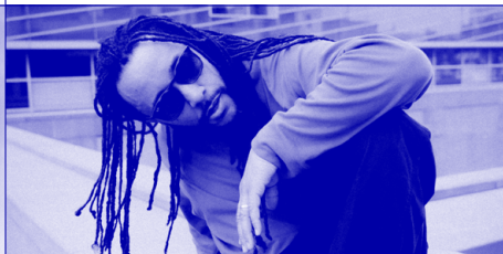
Chorégraphe ★ New York

Maison des Arts et de la Création (Sciences Po Paris); Semaine de la Critique du Festival de Cannes; Margaret Herrick Library – Academy of Motion Picture Arts and Sciences, Los Angeles