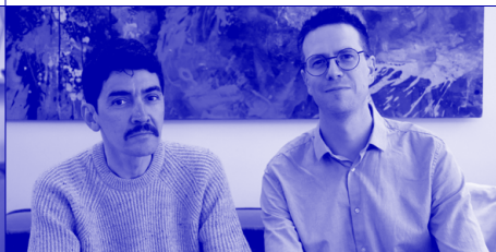
Réalisateurs ★ Washington, D.C.

Observatoire de l'environnement nocturne (CNRS), Toulouse; Getty Research Institute, Los Angeles; LACMA, Los Angeles; Fondation Bettencourt Schueller, Paris