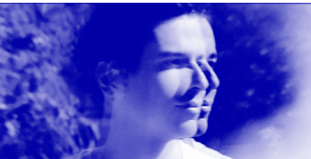
Compositeur, pianiste ★ Los Angeles