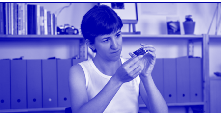
Designer, artiste visuelle ★ Los Angeles